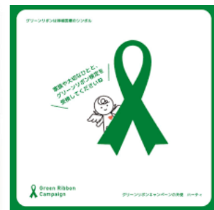
《富山県立中央病院 9/30~10/31まで掲示》