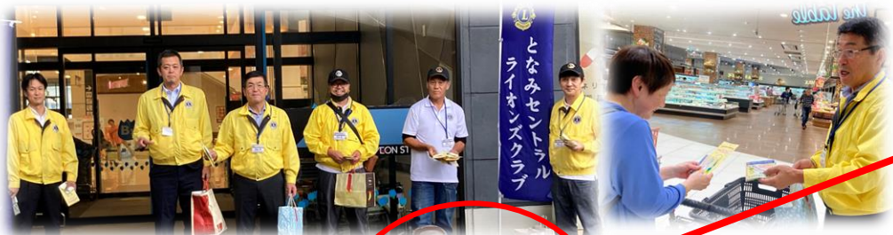
《となみセントラルLC：イオンモールとなみにて》