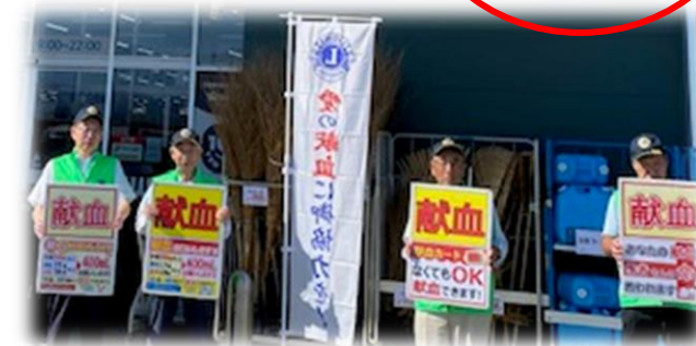
《黒部LC：PLAMT黒部店及び黒部市総合体育センターにて》

*入善LC 10/20(日) まつりんピック2024 献眼パンフレットと風船配布