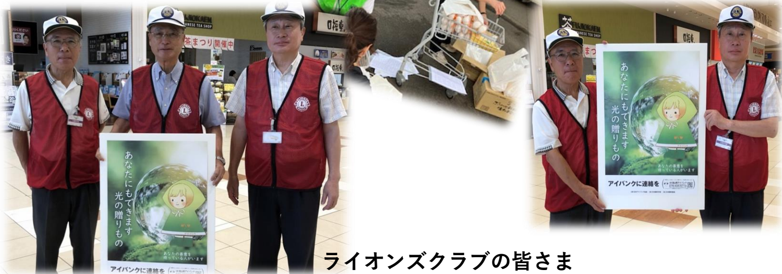
◀高岡LC：高岡イオンにて▶