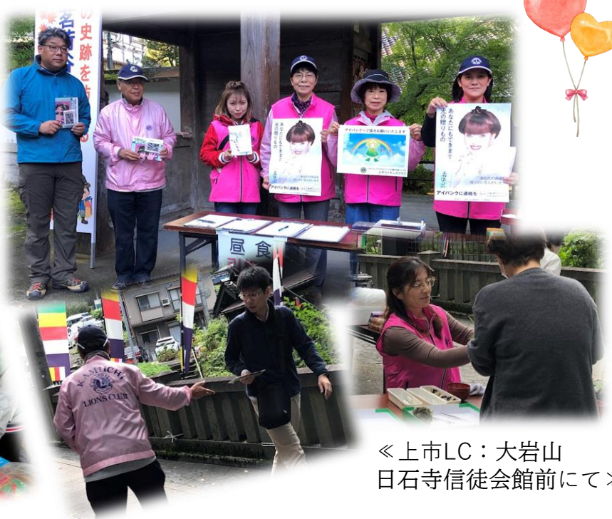
《上市LC：大岩山 日石寺信徒会館にて》