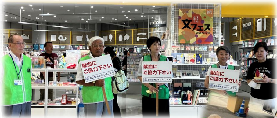
◀富山雷鳥LC：ファボーレにて▶