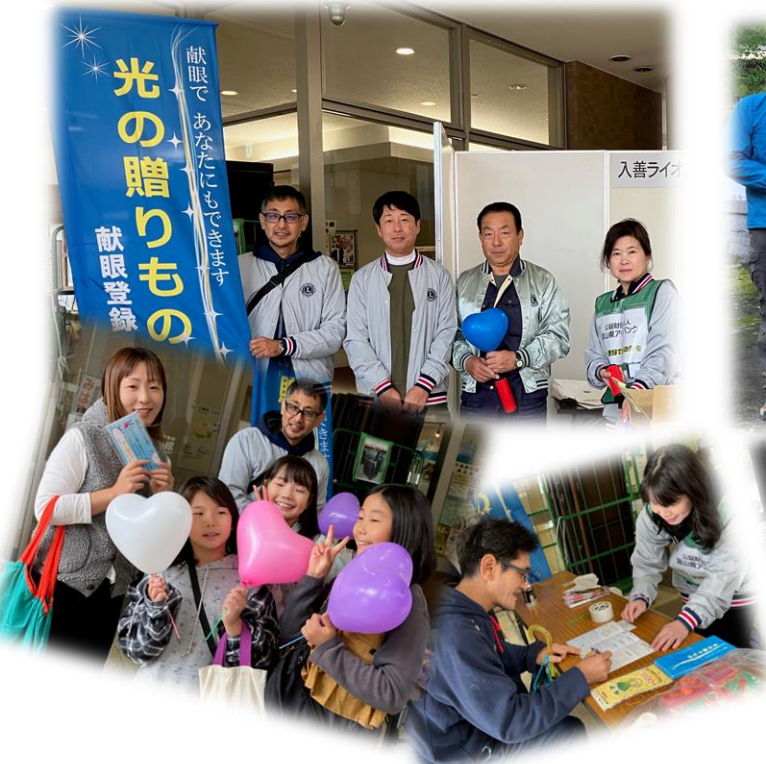
《入善LC：入善まちなか交流施設うるおい館にて》