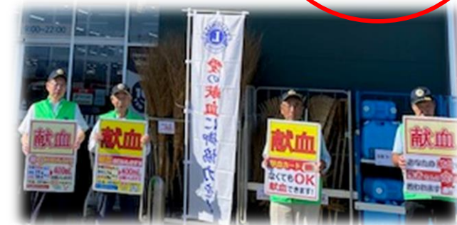
《黒部LC：PLAMT黒部店及び黒部市総合体育センターにて》