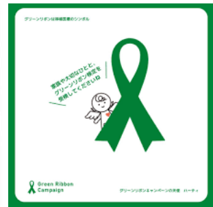
《富山県立中央病院 9/30～10/31まで掲示》