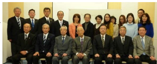
アイバンク広域活動連絡会参加者の集合写真

地区ブロック内のアイバンクから出された議題について意見交換し、アイバンク情報システムの内容について検討をおこないました。