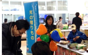
↑氷見 LC と

日 : 3月22日(日) 場所 : ハッピータウン氷見 内容 : 登録パンフレット&風船配布