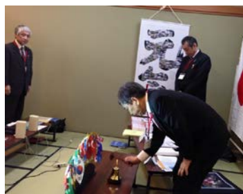
高岡アラート LC 例会の様子