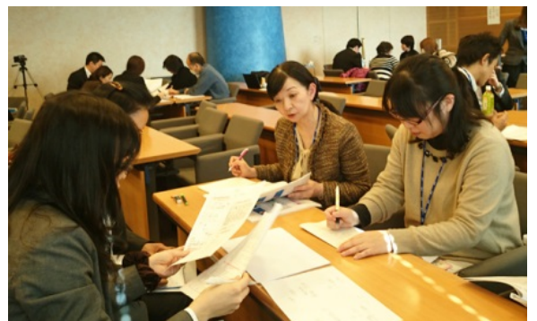
ロールプレイの様子。左手前が臓器移植NWコーディネーターの役(日本スキンバンクNWの方)。右から二人目が組織移植コーディネーター役で情報収集中(あきた医療移植協会のアイバンクコーディネーターの方)。

献眼以外のご提供が同時にある際にもスムーズに連携をとっていけるよう、このようなセミナーで学んでいます。