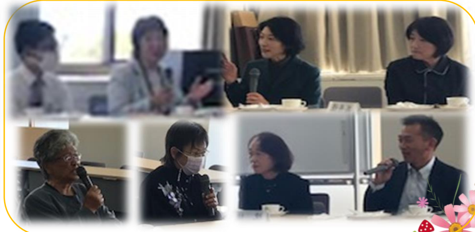
(懇談会・意見交換)富山県民会館にて