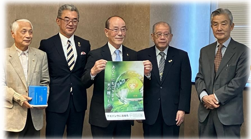
≪2024/10/10：富山新聞社にて取材≫