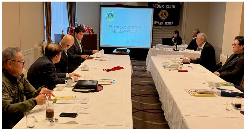
≪2024/12/3：ホテルグランテラス富山にて≫