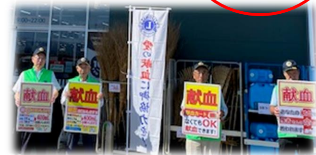
《黒部LC：PLAMT黒部店及び黒部市総合体育センターにて》