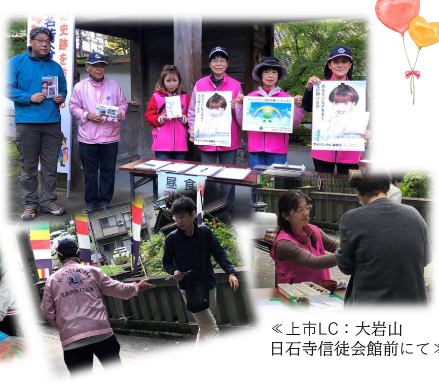
《上市LC：大岩山日石寺信徒会館にて》