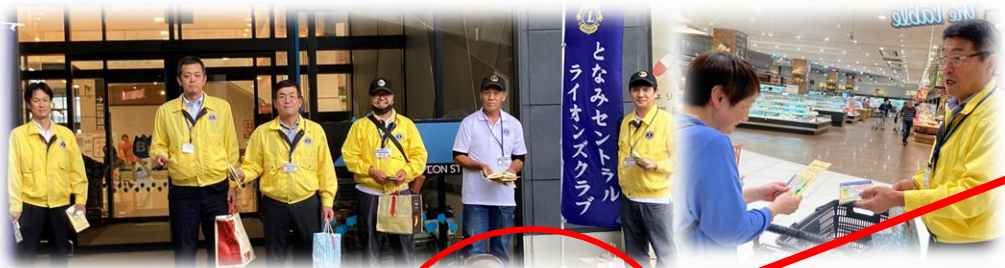
《となみセントラルLC：イオンモールとなみにて》