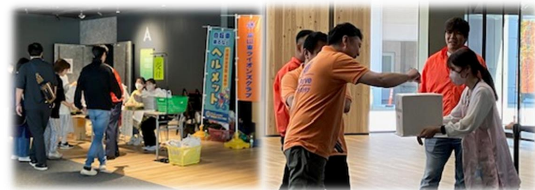
《富山東LC：オーバードホール中ホールにて》