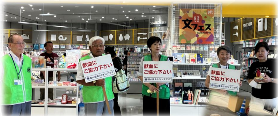
◀富山雷鳥LC：ファボーレにて▶