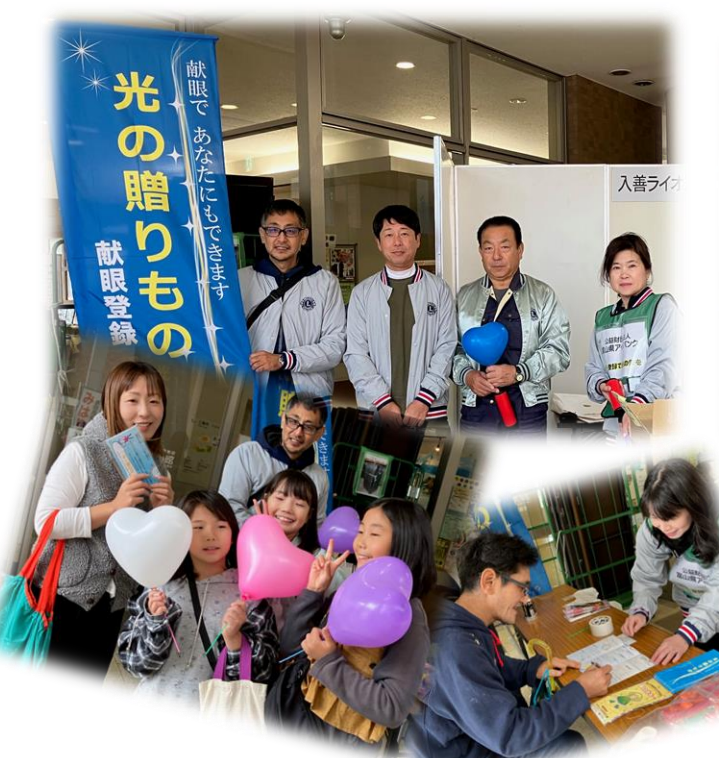
《入善LC：入善まちなか交流施設うるおい館にて》