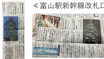
《北日本新聞》 《富山新聞：2024/10/17掲載》