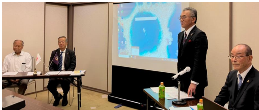
≪2024/12/5：富山高志会館にて≫