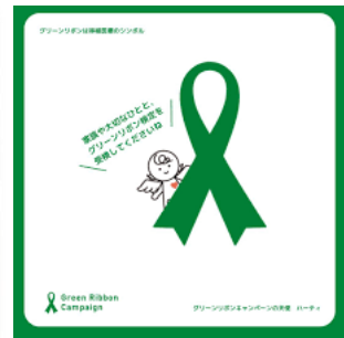
《富山県立中央病院 9/30～10/31まで掲示》